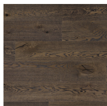
Heritage Oak Old Brown

Obrázky jsou pouze ilustrativní. Pro více informací o vzhledu a variacích si prohlédněte Grading Book nebo www.tarkett.cz . Mezinárodní sortiment Tarkett materiálů se skládá z mnoha rozdílných produktů. Dostupnost v jednotlivých zemích se může lišit. Přestože jsme se snažili reprodukovat fotografie, které by reflektovaly konečný produkt, kvalita monitoru nebo tiskárny a přirozenost dřeva může mít za následek rozdíly v barvě a struktuře jednotlivých lamel.