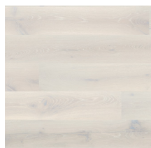
Heritage Oak Opal White