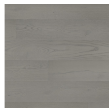
Heritage Oak Dove Grey