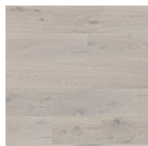
Heritage Oak Urban Grey