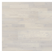
Heritage Oak Chalk White