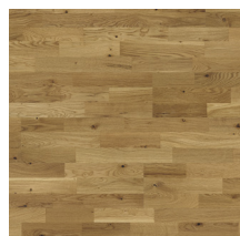
Heritage Oak Classic