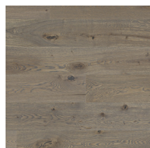
Heritage Oak Old Grey